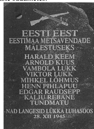
Tekst Lükka mälestussambal

Minu veenmisoskusest seda muuta jäi väheseks: kui mina soovivat nende nimede jäädvustamist, siis võivat organiseerida omaette mälestuskivi. Nende sännalaste vahele tekkis mõra ja tundsin sellest piinlikust, ent ega needki kaks eesti meest meist unustatud ei ole, nende nimed on omaste südames.