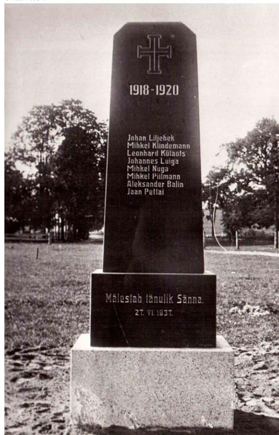
Vabadussõja ausammas Sannas

mälestussambale on kantud ka kahe teistel rinnetel langenute sännalaste nimed, oli loogiline ettepanek Valevile, kui mälestuskivi püstitamise mõtte algatajale, kivi püstitamise organiseerimise ja tööde teostamise eestvedajale, kanda kivile ka nende kahe hukkunud sännalase nimed. Seda lootsid ka nende lähedased, kes oma soovi edastasid minu kaudu Valevile ja toetasid kivi püstitamist tavapärasest suurema rahasummaga. Ent Valevi põhimõttekindlus ja omapoolne seisukoht olid järsult eitavad.