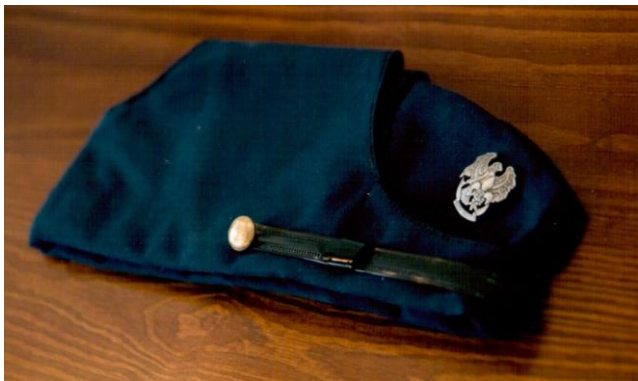
Valevi läbi aegade säilitatud noorkotka vormimüts