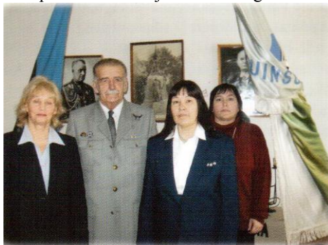
Sakala Noorte Kotkaste ja Kodutütarde Seltsi juhatus