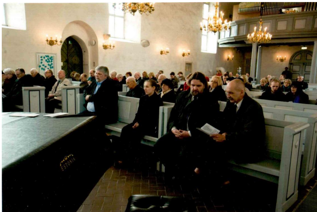
Hetki Valevi ärasaatmisest Jaani kirikus