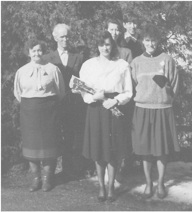
Pere pidulikult koos