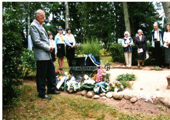
Sakala Kodutütarde ringkonna vanema haul Karksi-Nuia Rahumäe kalmistul, mälestuskivi avamine juuli 2007

"Tule taevas appi", esikommarit Ansipit tsiteerides. Oleme ise süüdi et vabatahtlikult vanglasse läksime, Siberisse läksime. Jah, kommarid saavad seda isegi tõestada. Iga vene ajal vanglasse viidud kirjutas oma käega "Tulin vanglasse nr (järgnes vangla number) sel ja sel kuupäeval. Kes vabatahtlikult ei kirjutanud tulin, vaid proovis kirjutada toodi, sellelt kõige otsesemalt peksti välja sõna tulin.