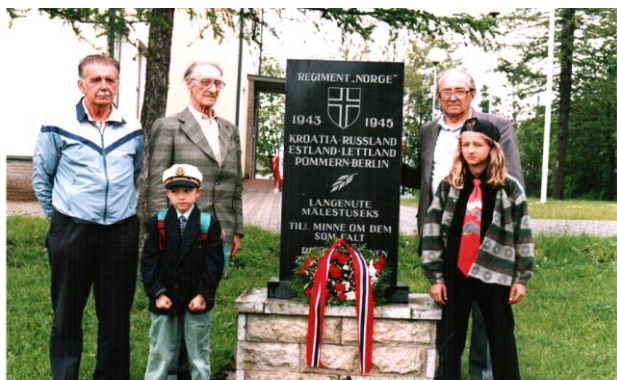
Mälestussammas Sinimägedel Norra vabatahtlikele, kes aitasid hoida Eestit ja Euroopat veel pool aastat langemast Vene terroristide ikkesse

Kurb kogu selle loo juures on see et "hääli kommunistile" ei ole paljude eestlaste - ka Siberi läbiteinutele - kuritegu eesti rahva vastu.