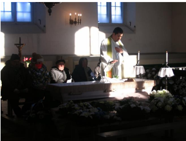
Kirikuõpetaja viimane palve Hansu ärasaatmisel Rõuge kirikus.